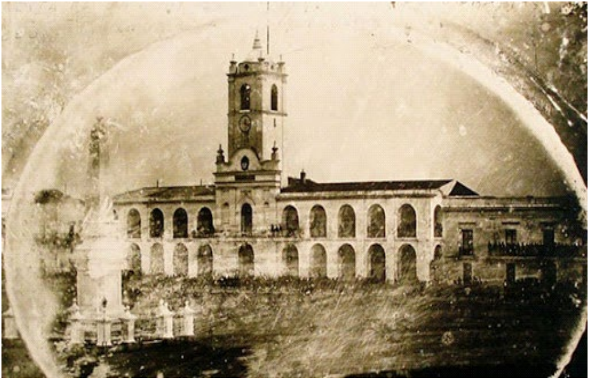
Cabildo Actualmente. Buenos Aires