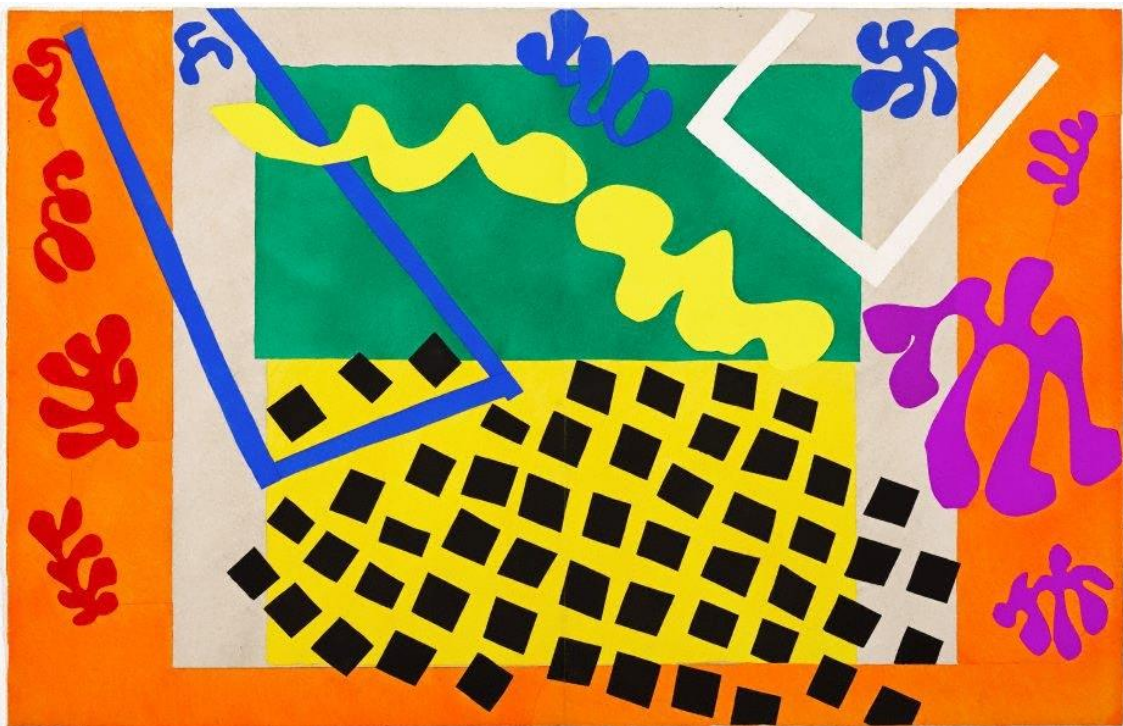
Las codomas – Henri Matisse