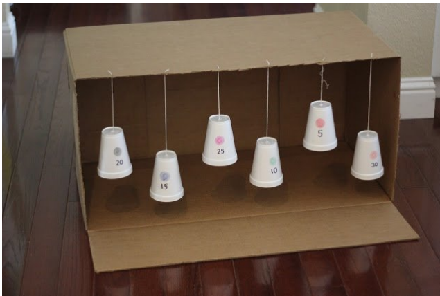
Imagen del juego de puntería.

Construcción: podemos utilizar una caja para colgar los elementos que escojamos para objeto de puntería, sino, podemos colgarlos de algún palo/varilla o simplemente una soga. Tomamos cada elemento y les unimos un hilo, con el cual los vamos a colgar de la parte superior de la caja, o del palo/varilla. Una vez que lo hacemos, podemos jugar apuntándoles con un bollito de papel, una tapita, un bollito de medias, o los elementos que venimos usando para puntería o lanzamientos en las actividades de los días anteriores. Les dejo una imagen para apoyar la explicación.